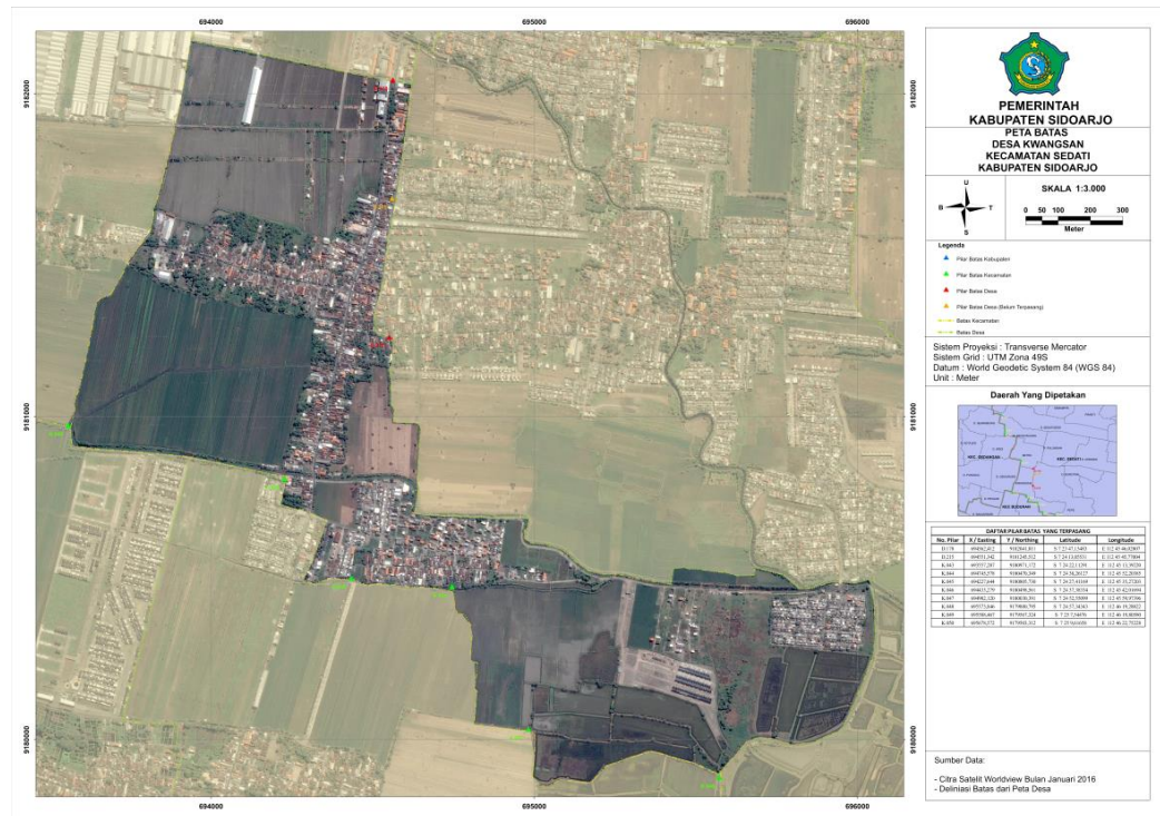
Gambar Peta Desa Kwangsan